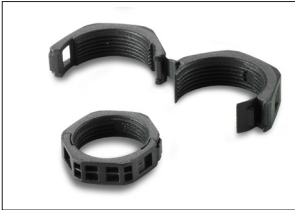
Lock Nut divisible, metric thread