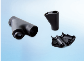
Y piece one-piece, divisible, IP40