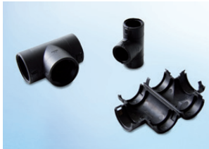
T Piece one-piece, divisible, IP40