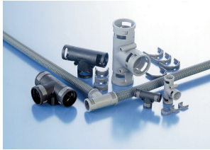
T Piece one-piece, IP68